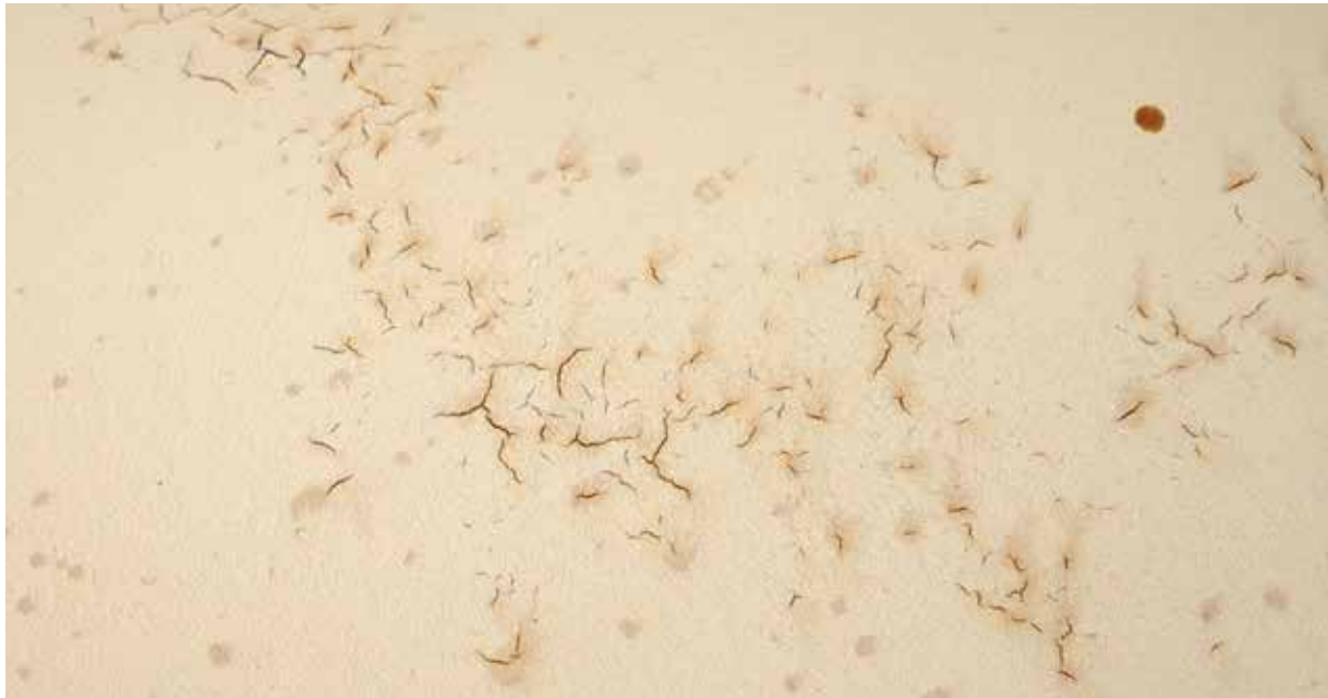
Abbildung 9: Korrosion auf dem Substrat

Die Beschichtung muss das Teil zuverlässig vor Korrosion schützen. Auch hier gilt: Je höher der erforderliche Korrosionsschutz desto höher der Aufwand und damit der Preis. Dabei sind nach Möglichkeit die konstruktiven Maßnahmen der QIB-Merkblätter 2-2 und 2-3 bzw. anderer normativer Vorgaben (DIN 55633, 55634) zu beachten. Dem Beschichter muss der erforderliche Korrosionsschutz (Korrosivitätskategorie und Schutzdauer) oder zumindest die späteren Einsatzbedingungen mitgeteilt werden, damit dieser den notwendigen Korrosionsschutz definieren kann.