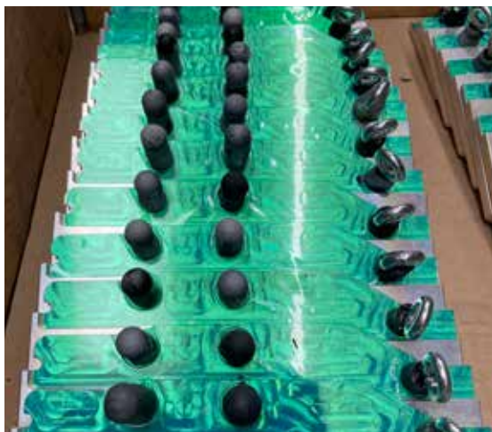
Abbildung 12: Maskierte Bauteile vor der Beschichtung

Bei einigen Teilen müssen verschiedene Flächen lackfrei sein. Das können Passflächen, Gewinde, Bohrungen oder Ähnliches sein. Bei Flächen wird in der Regel hitzebeständiges Klebeband verwendet, bei Bohrungen und Gewinden gibt es Abdeckungen aus Silikon. Beim Entfernen der Abdeckungen ist ein leichter Grat nicht zu vermeiden.