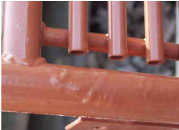
Abbildung 11: unverputzte Zinkverdükung

Da beim Feinputzen die Gefahr des Durchschleifens der Reinzinkschicht / Zinkhaut besteht, ist dies aus Gewährleistungsgründen mit der Verzinkerei abzustimmen und nur in Ausnahmefällen vom Beschichter durchzuführen. Ein Feinputzen vor dem Beschichten verbessert die optische Qualität.