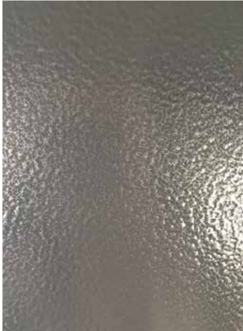
Abbildung 5: Grobstruktur