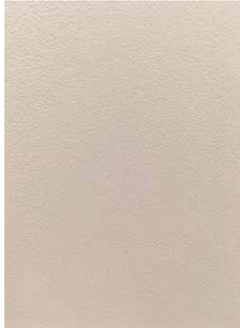
Abbildung 6: Feinstruktur

Diese Verläufe werden durch den Lackhersteller mittels Additiven eingestellt und können vom Verarbeiter nicht beeinflusst und verändert werden. Es ist zwingend erforderlich, bei der Bestellung die gewünschte Struktur mit anzugeben.