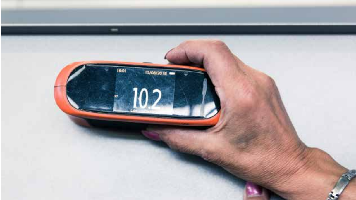
Abbildung 7: Glanzgradmessung

Der Glanzgrad ist ebenfalls eine Eigenschaft, die vom Lackhersteller eingestellt wird und ist zwingend für eine Bestellung erforderlich. Es haben sich folgende übliche Einstufungen in der Praxis durchgesetzt: