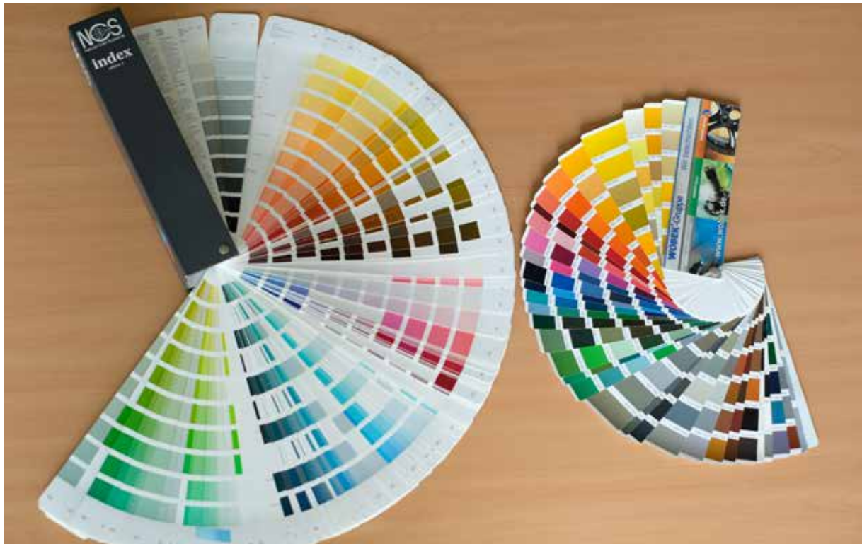
Abbildung 2: NCS Farbfächer und RAL-Farbfächer

Besonders beliebt im Bereich der Architektur sind z.B. die NCS-Farben. Allerdings muss dabei bedacht werden, dass diese auch Sonderfarben sind.