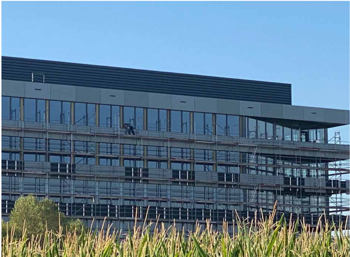
Abbildung 3: Farbtonabweichung an einer Fassade

Grundsätzlich ist die Vereinbarung eines Urmusters oder von Grenzmustern zu empfehlen.