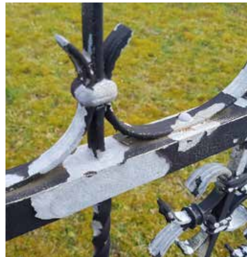
Abbildung 10: Zinkablösung nach der Beschichtung

Viele Probleme bei der Beschichtung von feuerverzinktem Material lassen sich auf mangelnde Kommunikation zwischen Auftraggeber, Verzinkungsbetrieb und Beschichtungsbetrieb zurückführen. Insoweit muss der Verzinker bereits bei Auftragserteilung darüber informiert werden, dass eine nachfolgende Beschichtung durchgeführt werden soll (siehe auch DIN EN ISO 1461, NB).