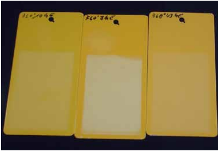
Abbildung 4: Bewitterungsstabilität, Kreidung

Es ist nicht nur wichtig den Farbton zu wählen, sondern auch die Einsatzbedingungen zu kennen, um die richtige Farbauswahl zu treffen: