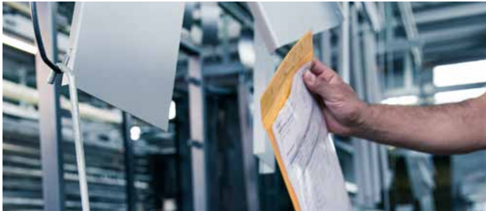
Abbildung 1: Beschichtungsprozess

Vielleicht fragt sich mancher Einkäufer beim Lesen unseres Merkblattes, weshalb der Beschichter all diese Fragen stellt. Möchte er eventuell das Produkt nachbauen? NEIN, natürlich nicht. Nach dem Lesen wird klargeworden sein, weshalb es so wichtig ist, all diese Punkte zu hinterfragen.